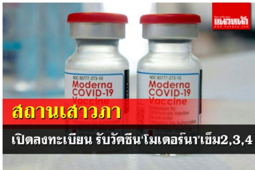
'สถานเสาวภา'เปิดให้พช.ลงทะเบียน รับวัคซีน'โมเดอร์นา'เข็ม2,3,4 วันอังคาร ที่ 15 มีนาคม พ.ศ. 2565, 09.35 น.

เว็บไซต์ : https://www.naewna.com/local/641368