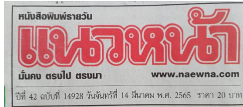
ข่าวหนังสือพิมพ์ ประจำวันจันทร์ที่ 14 มีนาคม 2565